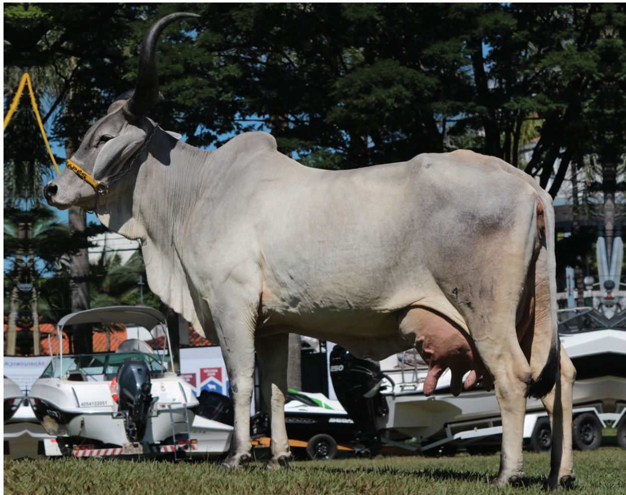
Nicarágua JF Grande Campeã Expozebu 2015