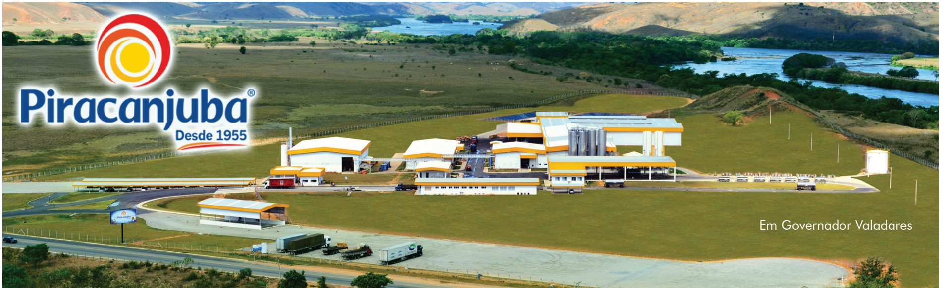
Em Governador Valadares

O destaque Indústria nos 10 anos do agronegócio, em Governador Valadares, foi a instalação da fábrica Laticínios Bela Vista, detentora da marca Piracanjuba, uma das maiores do segmento lácteo brasileiro. Com investimentos de R$60 milhões, a unidade processa mais de 300 mil litros de leite por dia e são gerados mais de 500 empregos diretos e indiretos, beneficiando toda a região do Vale do Rio Doce. O parque industrial da empresa conta com 12.000 m 2 de área construída, é um dos mais modernos do Brasil, com equipamentos de última geração para processamento de leite, com produção totalmente automatizada e um inovador sistema de rastreabilidade ativa, que permite identificar todo o percurso do leite desde a fazenda até a embalagem do produto. A unidade de Governador Valadares é a segunda unidade fabril da empresa fora do Estado de Goiás (a primeira fica na cidade de Maravilha, Santa Catarina). Juntas, as três unidades fabris possuem uma capacidade de processamento de mais de 4,3 milhões de litros de leite por dia.